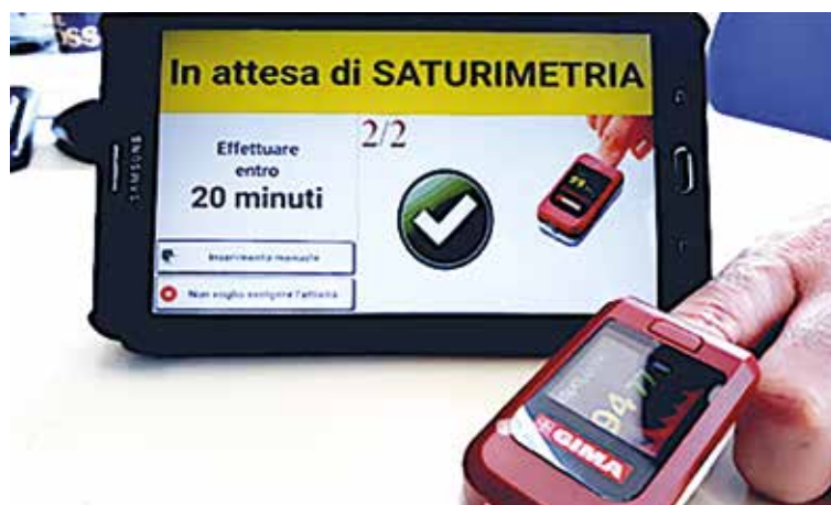
FIGURA 2 TEL.TE.CoViD19 MONITORA I PAZIENTI POSITIVI PER SARS-CoV-2 DELL'AREA PISANA

Circa 100 pazienti positivi per SARS-CoV-2 o con sintomatologia molto suggestiva per Covid-19 potranno essere reclutati. A partire dal 27 marzo scorso i primi 20 pazienti sono stati dotati dell'apparecchiatura necessaria per il telemonitoraggio clinico e sono stati collegati alla piattaforma informatica clinico-sanitaria. I Medici di medicina generale coinvolti nel progetto a fine marzo erano 20 e dunque il numero di pazienti reclutati è destinato a salire rapidamente fino alla completa distribuzione dei kit in dotazione. I pazienti coinvolti sono tutti residenti nella zona pisana dove per adesso la sperimentazione è stata avviata.